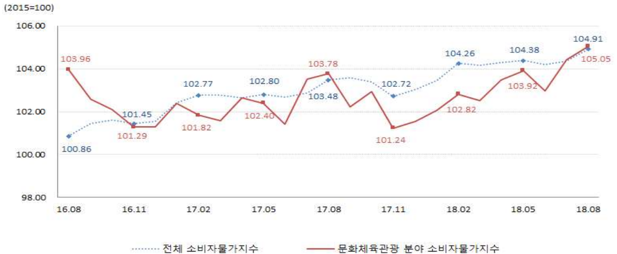
분야별 소비자물가지수 등락률